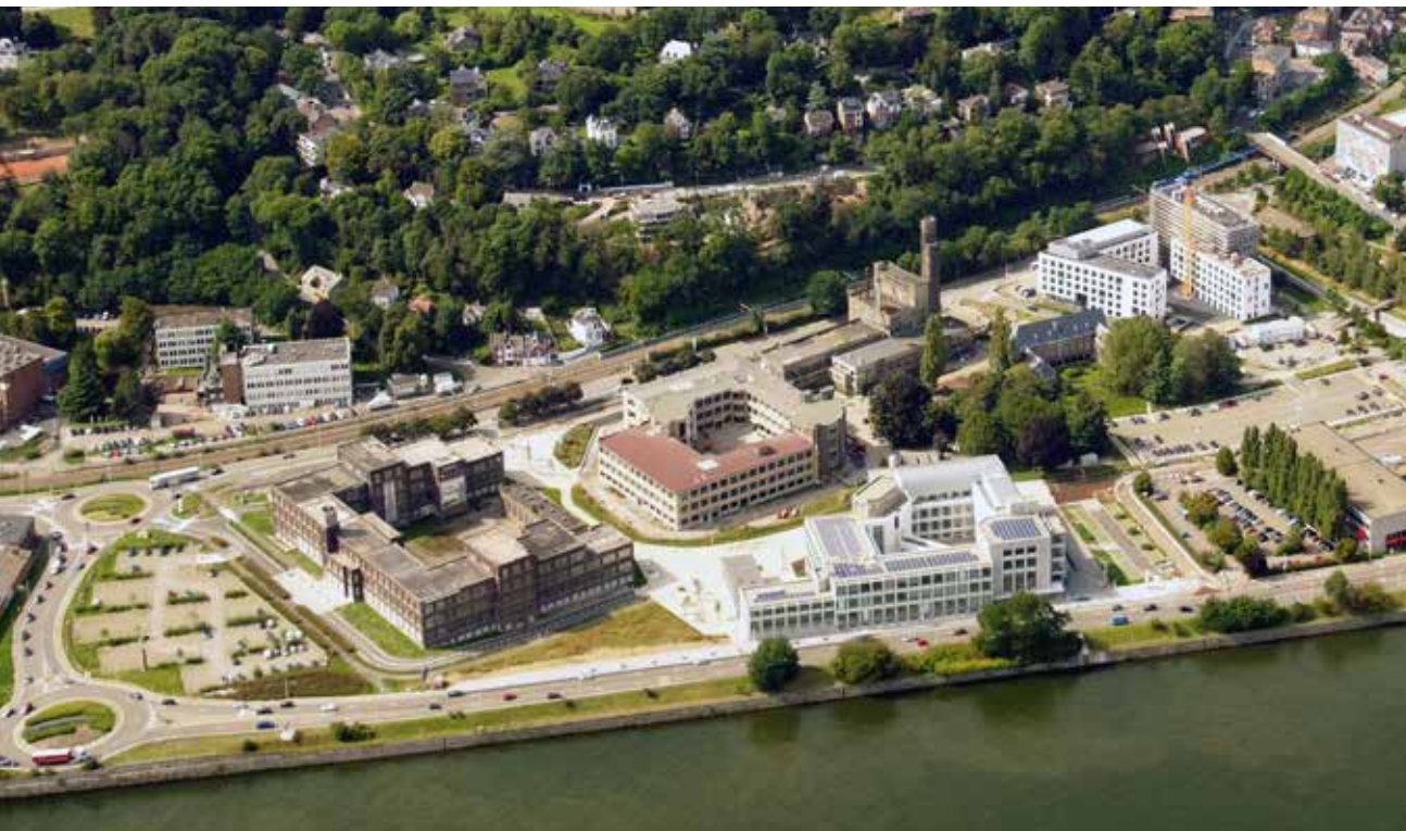
Liège - Val Benoit

En parallèle, vu la profonde transformation du modèle énergétique dans le court et moyen terme, et les objectifs bas carbone (qu'ils soient européens ou régionaux), il est nécessaire de faire prendre conscience aux entreprises et collectivités dans la dynamique de leur responsabilité sociétale et en les accompagnant sur ce point. L'évolution des législations, la taxonomie européenne et l'éligibilité aux financements conditionnée à des modèles durables rend nécessaire pour Spi de proposer des services d'accompagnement permettant une évolution du modèle économique des entreprises et des infrastructures qui les entourent, c'est-à-dire les parcs d'activité économiques. Il s'agit aujourd'hui d'une condition nécessaire pour rendre le territoire compétitif/attractif pour les investisseurs, exemplaire pour les générations futures et pour permettre aux entreprises de s'y développer.