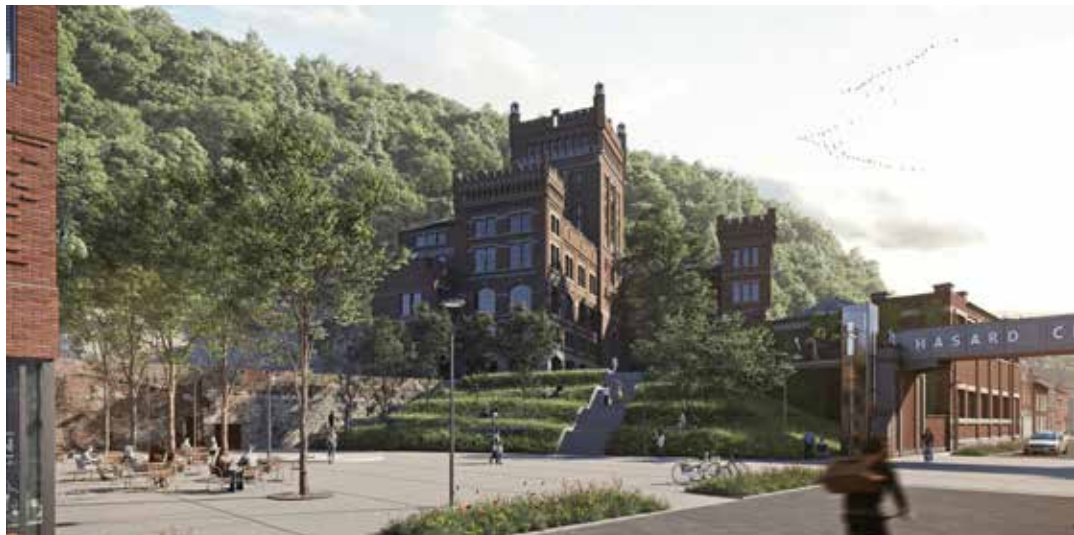
Cheratte - Charbonnage du Hasard

L'aspect territorial est un maillon essentiel pour déployer les solutions promues par l'économie circulaire et pour offrir des opportunités de création de valeur valorisant les potentialités et ressources locales. Spi anticipe les besoins et identifie le potentiel foncier réel, en termes de friches, de terrains et de bâtiments à assainir, pour répondre aux objectifs du stop béton tout en continuant à accueillir des projets porteurs de valeur ajoutée pour le territoire. Ce modèle, basé davantage sur la reconversion de sites et d'espaces à vocation économique (ressources foncières et immobilières), appelle à prendre en compte d'autres modèles économiques et d'autres temps de retour sur investissement.