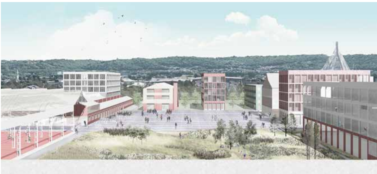
Herstal - ACEC

Des initiatives seront prises sur l'optimisation de la gestion du patrimoine immobilier de Spi, en termes financiers et énergétiques. Spi se positionnera sur les technologies permettant de réduire l'impact climatique et environnemental des entreprises et collectivités du territoire. Il s'agit de comprendre et saisir les opportunités en matière d'évolution des sources d'énergie pour le territoire, par la facilitation de projets supralocaux notamment.