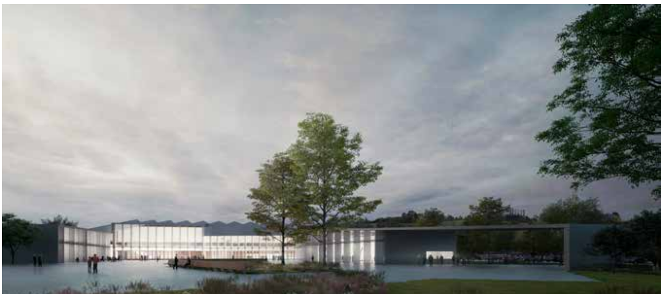
Liège - Halles des Foires de Coronmeuse

Au-delà des biens immobiliers et des espaces à vocation économique, Spi se met en capacité de proposer à ses clients des données et des informations sur leur territoire et se dote des compétences pour les faire résonner/articuler de façon opérationnelle avec les enjeux auxquels sont confrontés les collectivités, le territoire et les entreprises. La donnée devient ainsi un élément incontournable de la gestion du territoire.