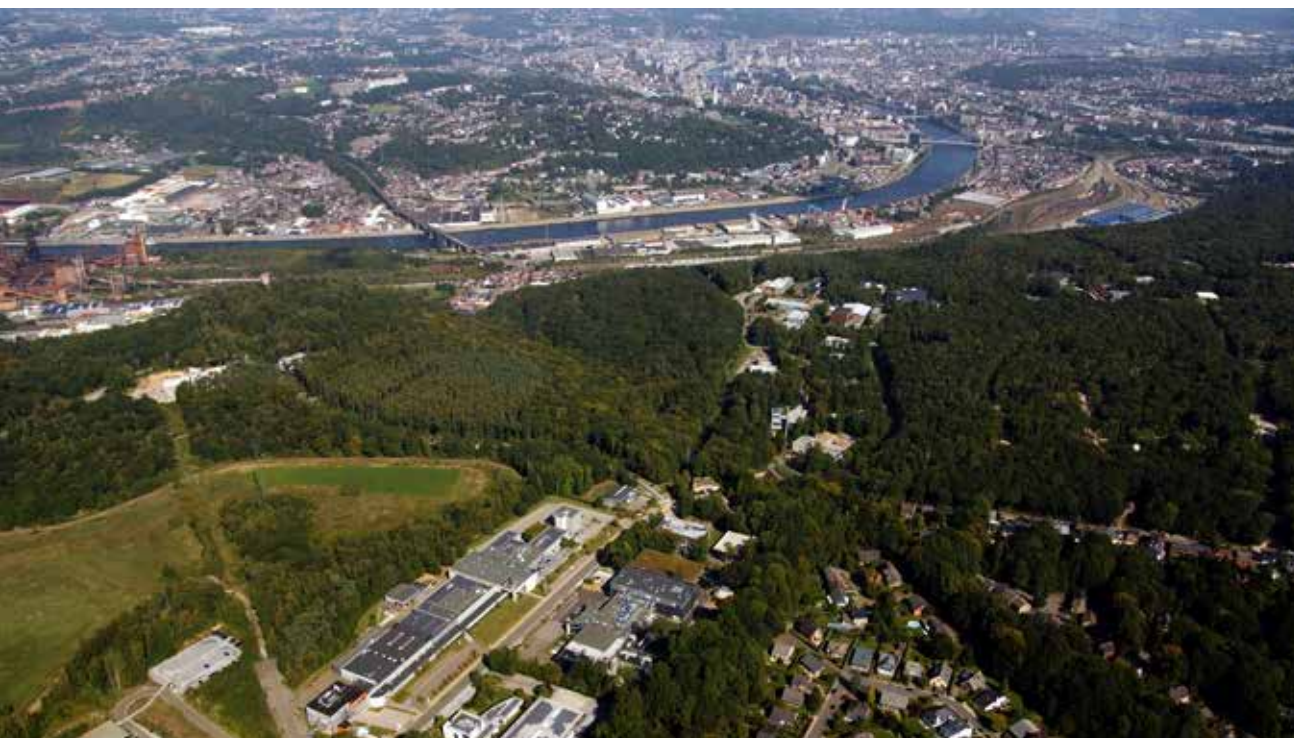
Liège Science Park

Avec l'horizon du « stop béton », Spi devra sélectionner les projets à externalités positives pour le territoire et être un moteur d'innovation dans les solutions foncières et immobilières proposées. En effet, le choix des différents projets au sein des espaces à vocation économique sera décisif pour initier une trajectoire innovante et durable, tout en laissant la porte ouverte à des hypothèses de réindustrialisation porteuses pour la province.