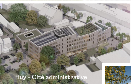
Huy - Cité administrative