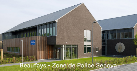
Beaufays - Zone de Police Secova