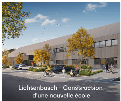
Lichtenbusch - Construction d'une nouvelle école