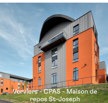
Verviers - CPAS - Maison de repos St-Joseph