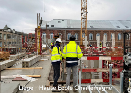
Liège - Haute Ecole Charlemagne