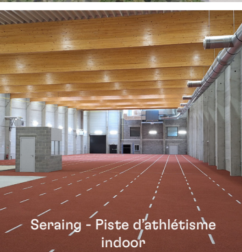
Seraing - Piste d'athlétisme indoor