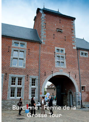
Burdinne - Ferme de la Grosse Tour