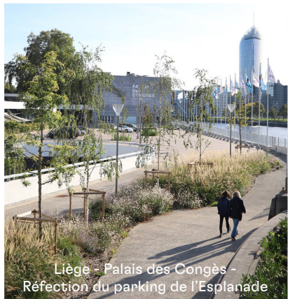
Liège - Palais des Congès - Réfection du parking de l'Esplanade

Prêt à donner de l'élan à vos ambitions ?