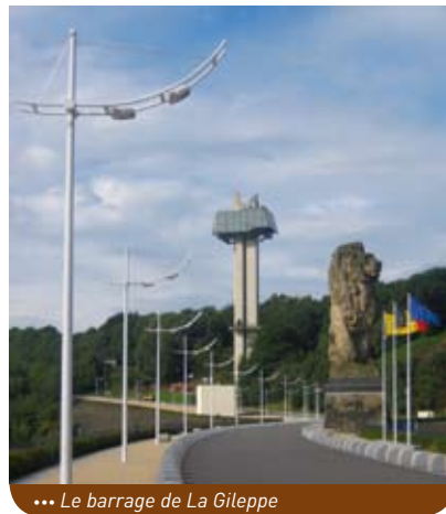
... Le barrage de La Gileppe

local de location de VTT. En outre, la réalisation de ce projet permettra de tripler voire quadrupler le nombre de groupes accueillis (80 places actuellement dans la tour panoramique). De nouvelles activités devraient également voir le jour : une zone barbecue et un espace multigénérationnel, une promenade forestière familiale, un sentier forestier didactique, une aire d'observation du gibier et, à moyen