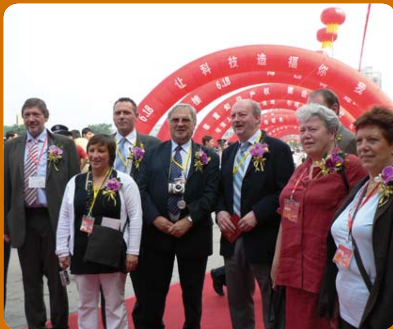
... mission officielle en Province du Fujian - Juin 2007

proposer aux producteurs de pierres chinoises l'établissement au Port autonome d'une plateforme de stockage, de transformation et de distribution de ses produits sur l'ensemble du continent européen. Une nouvelle qui, vous l'imaginez, a réjoui les autorités fujianaises sensibles non seulement aux nombreux atouts logistiques de Liège mais aussi à sa situation géographique privilégiée puisqu'au centre de l'Europe».