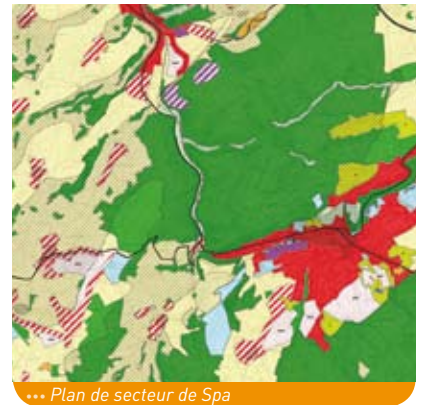
... Plan de secteur de Spa