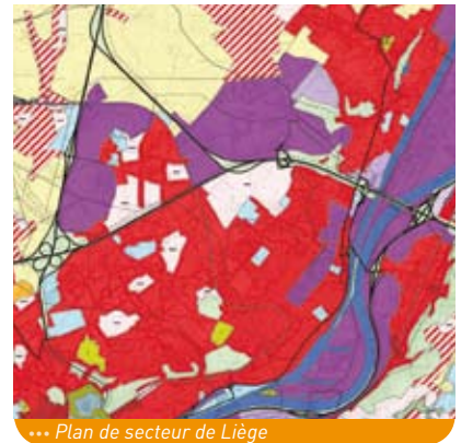
... Plan de secteur de Liège