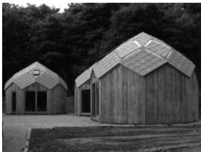
Le Préhistosite de Ramioul

En la matière, les exemples sont particulièrement nombreux. Citons la tribune du stade du Val Fassotte à Dison, le Grand Curtius à Liège (restauration de bâtiments classés et aménagement en centre d'interprétation et en musée), l'extension de l'école de Walhorn à Lontzen, la réalisation du hall omnisports de Verlainne ou la restauration, à Verviers, des maisons de repos Saint-Joseph et Sainte-Elisabeth pour le compte du CPAS.