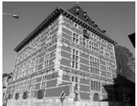
Le Musée Curtius à Liège

A tout seigneur, tout honneur: débutons ce (très partiel) tour d'horizon par cet extraordinaire témoin patrimonial qu'est le 'Grand Curtius', ou plutôt, sous sa dénomination officielle, l'EMAHL, l'Ensemble muséal d'art et d'histoire du Pays de Liège.