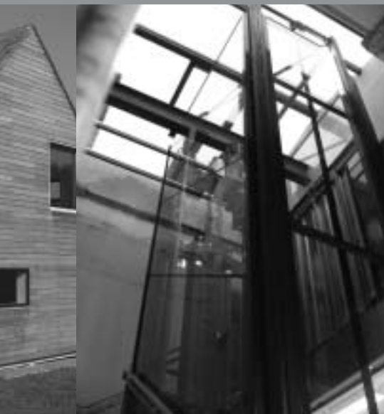
L'ascenseur de la maison communale de Sprimont

police, qui regroupe également les entités de Trooz, Esneux, Aywaille et Sprimont. A Sprimont, justement, la commune a également fait appel à la SPI + dans le cadre de son projet de transformation du château communal en vue d'une accessibilité accrue pour les personnes à mobilité réduite.