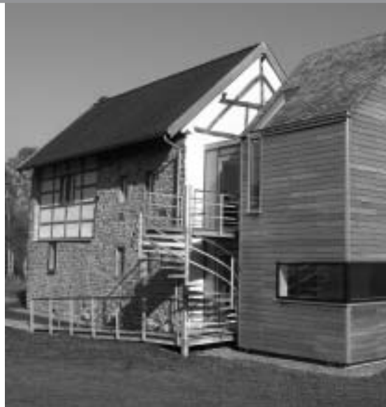
La maison 'Wauters' à Plombières