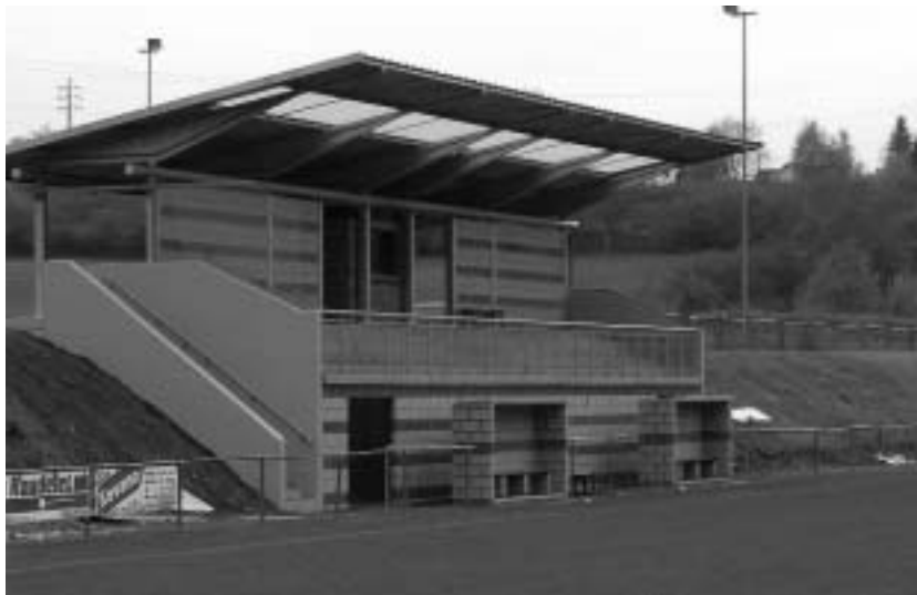
La tribune du stade du Val Fassotte à Dison

Proche des communes, ses membres et clients à la fois, la SPI + a de suite compris l'importance du projet auquel l'intercommunale CHRH (Centre hospitalier régional de Huy) et l'asbl 'Crèche petit à petit' lui proposaient de s'associer en tant que maître d'ouvrage: celui de la construction, juste à côté de l'Espace Entreprise de Tihange, d'une crèche de 24 lits. Un bâtiment préfabriqué de plain-pied et d'une surface de quelque 400 m 2 .