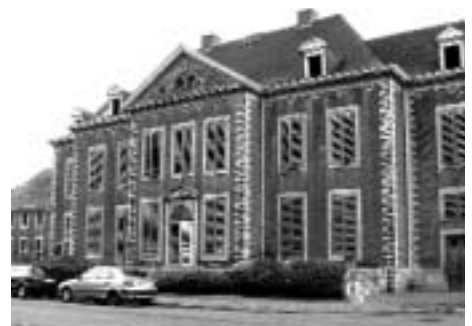
Le château Nagelmackers

C'est vers la SPI + que les autorités communales sprimontoises se sont tournées afin de dynamiser l'actuel musée de la Pierre en y créant un centre d'interprétation de la pierre, auquel sera adjointe une zone d'exposition temporaire. Un investissement de 1,75 million €, en partie couvert par la Région wallonne et la Province de Liège.